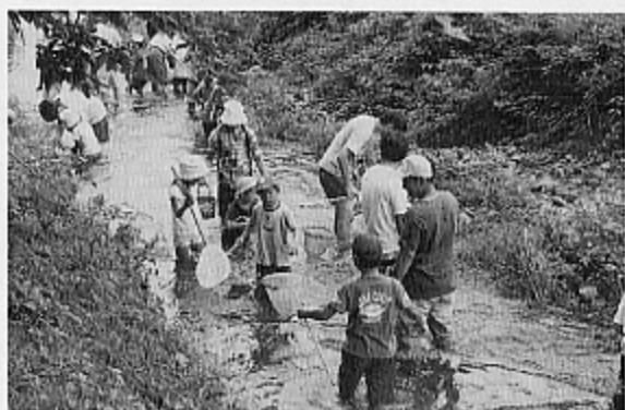
▲不老川で魚とり (文章とは関係ありません。)

私の家から7〜8分の所に環境ウォーキングのコースにもなった笹井ダムがあります。久しぶりに子供のころよく遊びに行ったそのダムまで歩いてみると、茶畑やその時は誰のもの