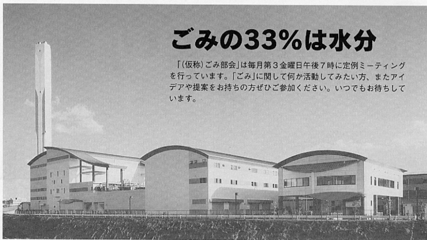
▲入間市クリーンセンターとリサイクルプラザ

「(仮称)ごみ部会」は毎月第3金曜日午後7時に定例ミーティングを行っています。「ごみ」に関して何か活動してみたい方、またアイデアや提案をお持ちの方ぜひご参加ください。いつでもお待ちしております。