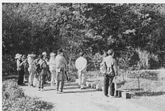
◀ 昨年の環境ウォーキング