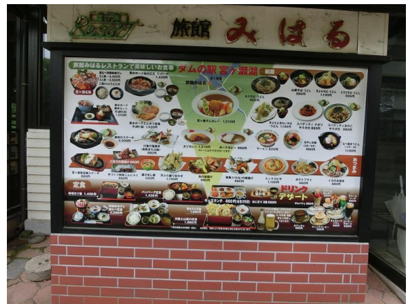
みはるのメニュー