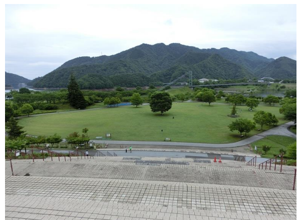
どこまでも広い園地