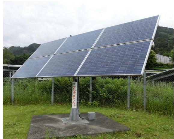
赤外線センサーによる2軸式自動追跡