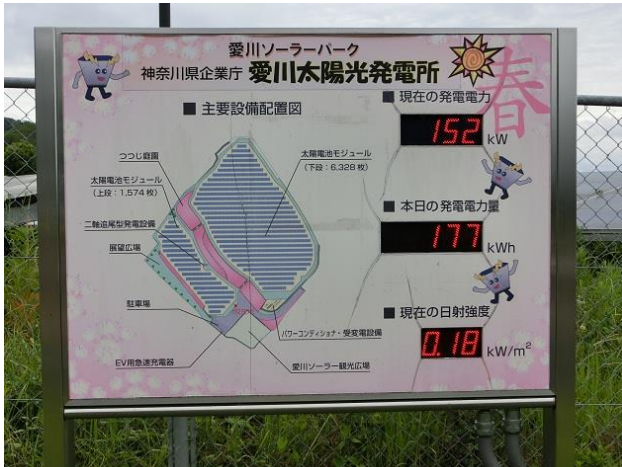
くもりでも僅かに発電

7. 今回の見学は時間に余裕があったため2時間も早く帰着することが出来た。準備に参加していただいた関係課、温暖化防止部会の方々に感謝、